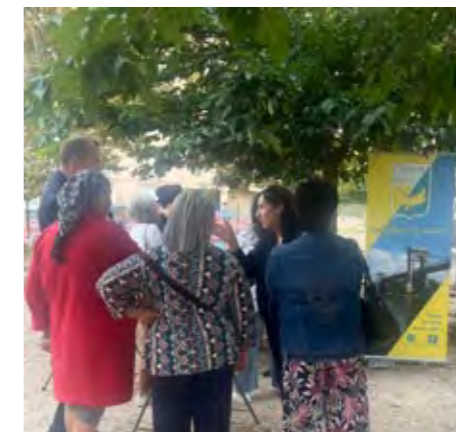
Quartier des Barbières