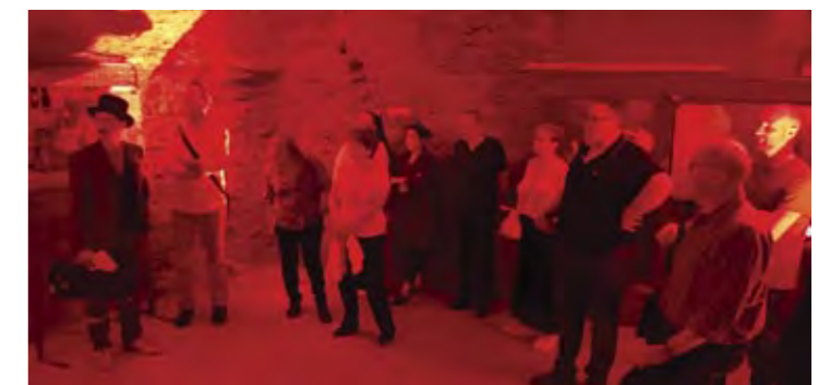
2 ème sous-sol après