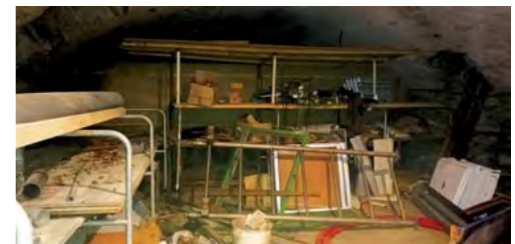
2 ème sous-sol avant