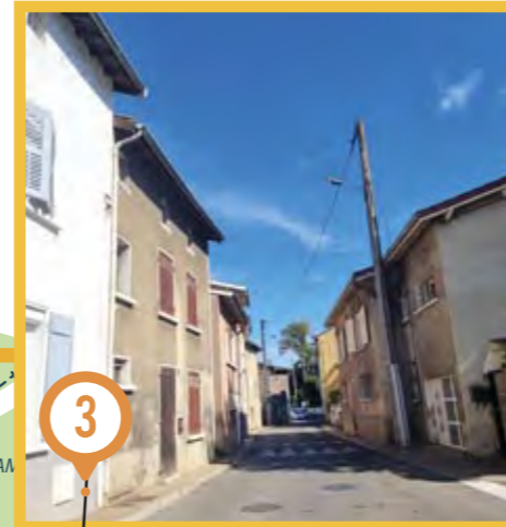
Rue de la République : travaux d'assainissement, sur les conduites d'eaux pluviales et d'eaux usées.