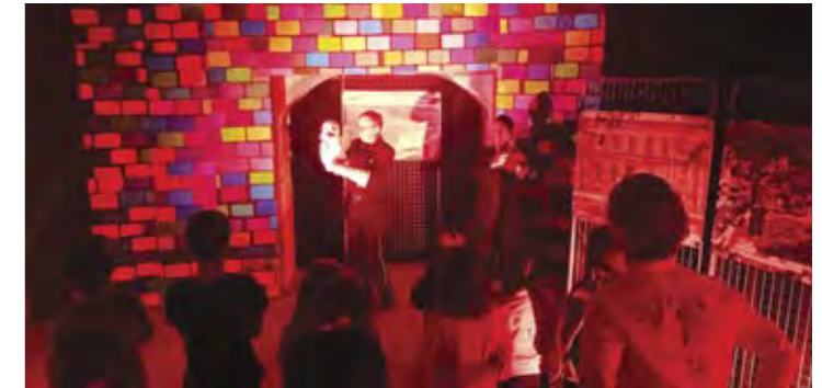
1 er sous-sol après

Peu de gens le savent, mais le bâtiment du Château regorge de surprises. Pour ces journées du Patrimoine la Municipalité et la MJC ont décidé de vous faire découvrir une partie des sous-sols du Château.