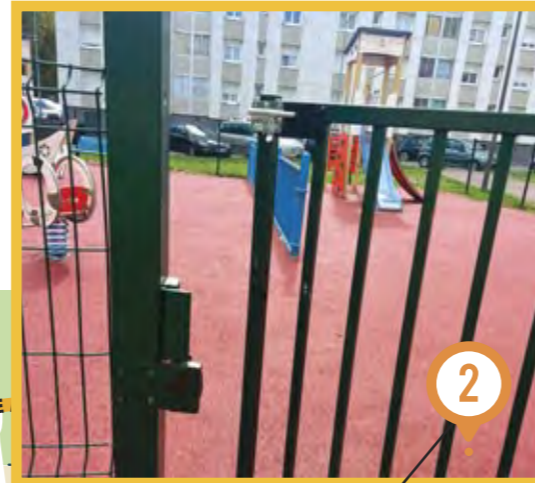
Nouveau système de fermeture à l'aire de jeu des Barbières