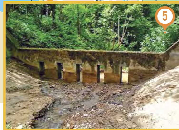
Curage du piège à gravier dans le Gorneton, pour prévenir les risques d'inondations.

1 1 ère phase enfouissement des réseaux secs (page 17)