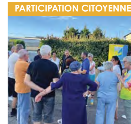
Chemin des Goules