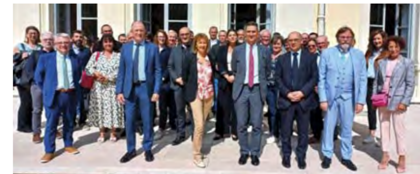
Rencontre en Préfecture des 14 maires de l'Isère dont les villes ont été sélectionnées pour le programme Petites villes de demain , le 11 septembre 2024.

Pour assurer la cohérence d'ensemble du programme Petites villes de demain , la commune de Chasse-sur-Rhône a décidé de traduire ces grandes orientations et les actions en découlant dans un plan-guide. Ce document graphique est une traduction cartographique des ambitions portées par les élus, et fixe les grands principes d'aménagement du projet urbain retenu. Il offre ainsi l'assurance d'un projet intégré et d'une cohérence de l'ensemble des actions.