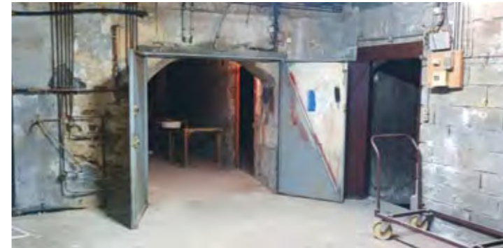
1 er sous-sol avant