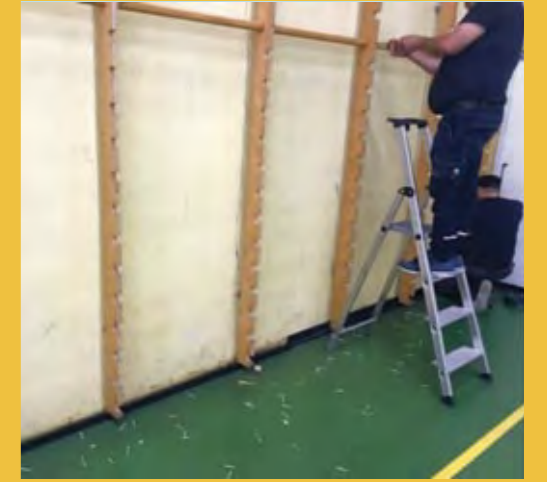
Les services techniques du bâtiment de la Ville ont entrepris un chantier au gymnase municipal. Celui-ci n'avait pas connu de réhabilitation depuis de nombreuses années. Les agents ont nettoyé, rebouché les trous, ponçés et peint l'ensemble des murs du gymnase.