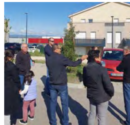
Allée France Gall