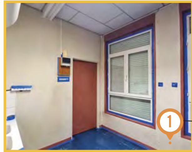
Peinture de la salle de cuisine de l'école maternelle des Barbières.